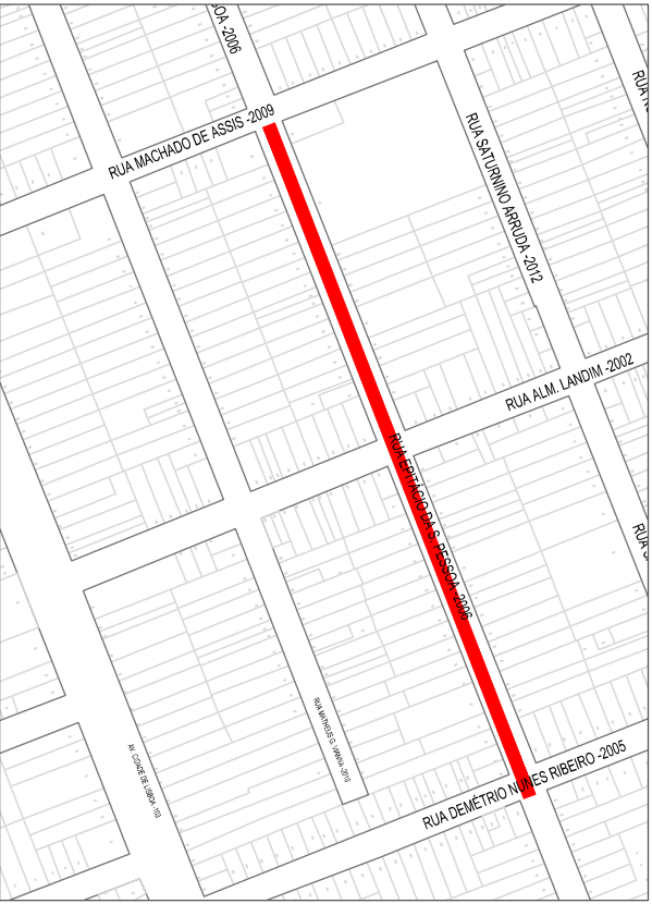
PLANTA SITUAÇÃO ESC. 1:5000

OBSERVAÇÕES: TODOS OS DADOS FORAM OBTIDOS PELO SERVIÇO AUTÔNOMO DE SANEAMENTO DE PELOAS APÓS VISITA TÉCNICA.